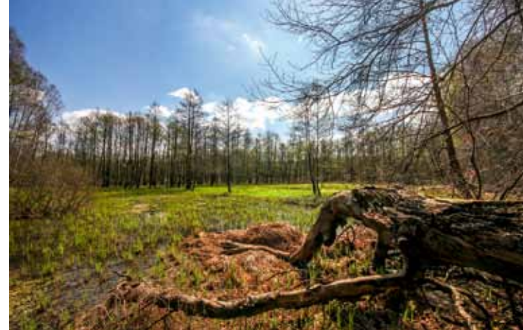
Feuchtwiese am Rundweg.