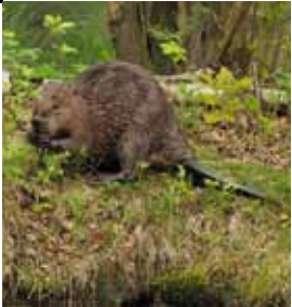
Der Biber lebt am Dagowsee.

Ausgangspunkt der Tour ist das Stechlinsee-Center im Neuglobsower Ortskern. Dort sind die „Libelle“ des Zehdenicker Künstlers Uwe Thamm und der „Gaukler“ von Stephan Möller aus Berlin zu betrachten. Der Weg folgt dem Ufergang am Dagowsee entgegen dem Uhrzeigersinn. Schon bald sind hier die unverkennbaren Fraßspuren des Bibers zu entdecken. Eine Infotafel beschreibt seine Lebensweise.