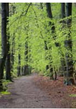
Wanderweg am Stechlin.