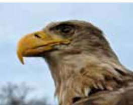
Seeadler brüten im Naturschutzgebiet Stechlin.

„Zwischen flachen, nur an einer einzigen Stelle steil und quaiartig ansteigenden Ufern liegt er da, rundum von alten Buchen eingefasst, deren Zweige, von ihrer eignen Schwere nach unten