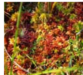
Torfmoose sind typisch für Moorwälder.