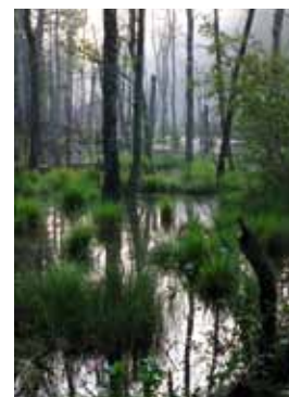
Moorwald im Dagowseebruch.