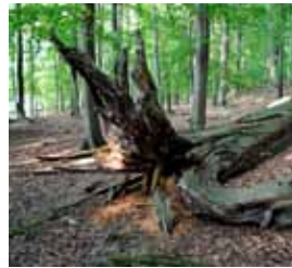
Naturnahe Wälder haben einen hohen Totholzanteil.

Am Abzweig des Wanderweges nach Kleinerlang und Rheinsberg führt die Route rund um den See weiter auf dem Uferweg. Eine Infotafel berichtet über die historische Dorfstele Stechlin, die vom 11. bis 16. Jh. besiedelt war.