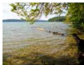
Weiter Blick über den See