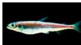
Die Fontane-Maräne kommt weltweit nur im Stechlin vor. Für diese Art trägt der Naturpark eine besondere Verantwortung.