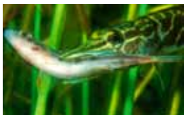
Der Hecht hat gute Sicht, um reichlich Beute zu jagen.