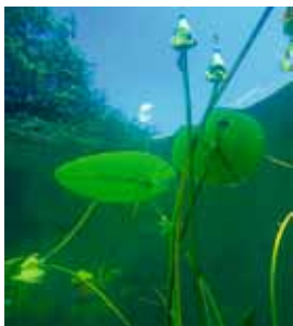
Der Stechlin aus der Fischperspektive.

gezogen, den See mit ihrer Spitze berühren. Hie und da wächst ein wenig von Schilf und Binsen auf, aber kein Kahn zieht seine Furchen, kein Vogel singt, und nur selten, daß ein Habicht drüber hinfliegt und seinen Schatten auf die Spiegelfläche wirft. Alles still hier.“