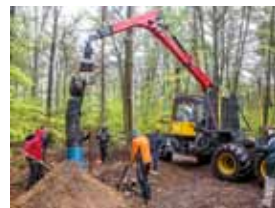
Der Landesforstbetrieb und die „freiwillige Rentnerbrigade“ aus Neuglobsow halfen bei der Aufstellung der Skulpturen.