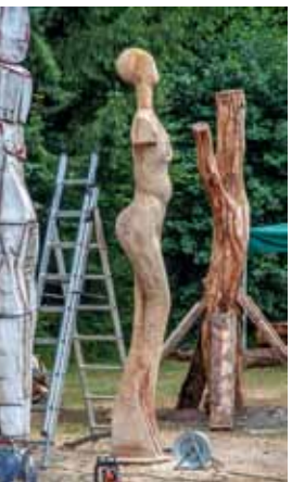
Die Skulpturen in der Entstehung. Ein herzliches Dankeschön an die Waldarbeitsschule und die Landeswaldoberförsterei Steinförde für die logistische Unterstützung.

In jeweils nur elf Tagen verwandelten Künstlerinnen und Künstler aus mehreren Ländern massive Eichenstämme in elf Holzskulpturen, die heute entlang des Dagowsee-Rundwegs im Naturpark Stechlin-Ruppiner Land bewundert werden können. Als Teilnehmer von zwei Symposien, zu denen der Kunstverein Zehdenick, der Naturpark und das EU LIFE-Projekt „Feuchtwälder“ eingeladen hatten, arbeiteten sie auf dem Gelände der Waldarbeitsschule Kunststernspring. Entstanden sind ganz unterschiedliche Kunstwerke zu den Themen „Zwischen Wasser und Land“ sowie „Biologische Vielfalt – Moorschutz – Klima“.